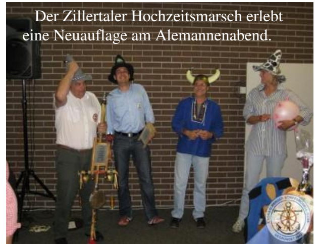
Der Zillertaler Hochzeitsmarsch erlebt eine Neuauflage am Alemannenabend.