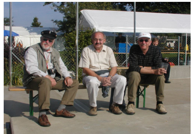
Die MSF aus Lahr auf dem Senioren Bänke!