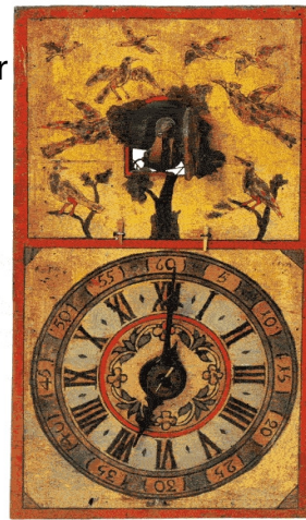
frühe Kuckucksuhr um 1760