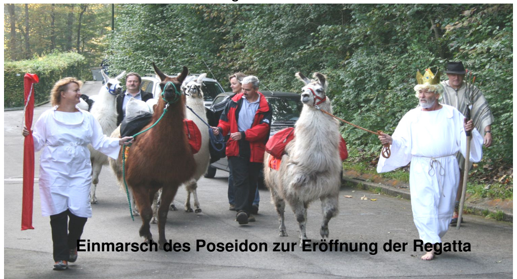
Einmarsch des Poseidon zur Eröffnung der Regatta