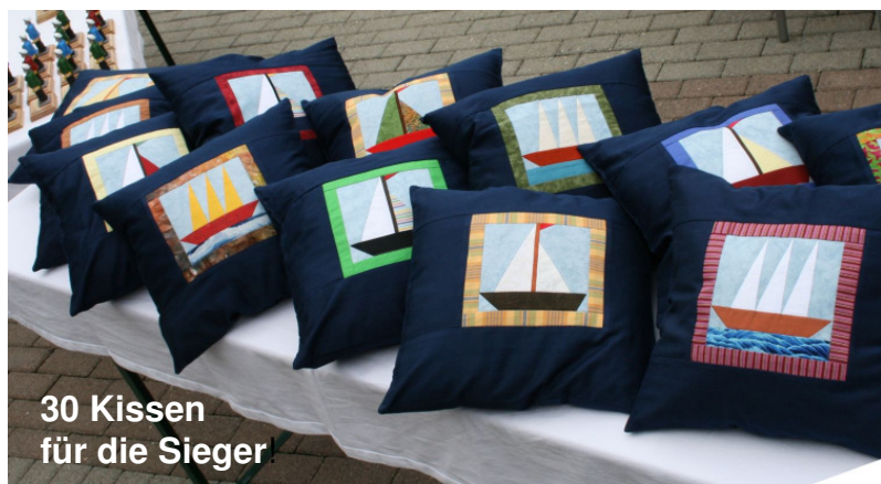
30 Kissen für die Sieger!

und 3, 4 Modellen am Wasser zügig weitergefahren. Unterbrochen lediglich durch die zahlreichen Läufe der Sea Jet Fahrer. Hier stellte sich heraus, dass besonders in der Expert Klasse wahre Meister zu finden sind, die mit ihren Modellen sehr präzise und zudem extrem schnell ihre Runden drehen. Den Abschluss machten die Funktionsschiffsmodelle mit ihren Vorführungen. Zur Siegerehrung trafen sich die Teilnehmer/Innen auf der Terrasse des Restaurants. Manch einer/e machte sich spätestens jetzt wohl Gedanken über die eigenartigen Preise. Da hatte sich die Vereinsleitung des 1. VSMC etwas Neuartiges einfallen lassen. Jeder der drei Erstplatzierten erhielt ein mit Segelschiffmotiven in Patch Work gestaltetes Kissen. Selbst in ganz ausgezeichnete Qualität von zwei Frauen des Vereins in mühevoller Arbeit hergestellt! Die Firma Graupner hat für die jugendlichen Teilnehmer tolle Preise zur Verfügung gestellt, worüber sie sich sicher sehr freuten! Dass es überall, wo gearbeitet wird, auch kleine Pannen geben kann, liegt in der Natur der Sache! Sieger der mit Spannung erwarteten Vereinswertung wurde der SMC Goldach, der somit die selbst gestaltete Wetterstation in seinem Vereinsheim aufhängen kann. Die wenigen, nicht ganz korrekten Urkunden sind in der Zwischenzeit aber schon zugeschickt worden. Mit dem Niederholen der Alemannenfahne wurde die 24. Alemannenregatta für beendet erklärt.