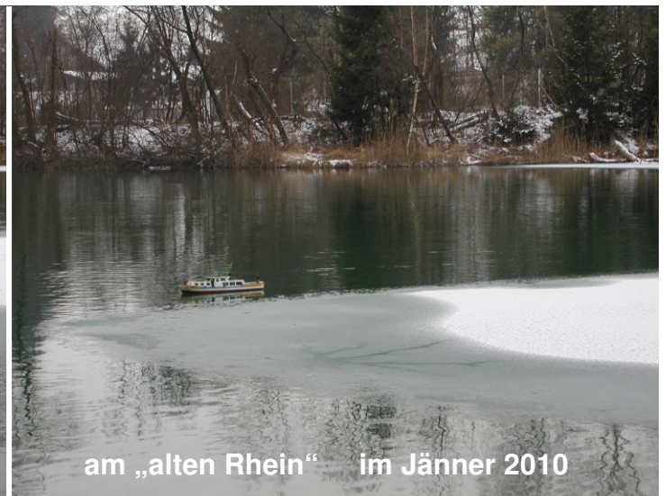
am „alten Rhein“ im Jänner 2010

Der heurige Februar, hat uns mit richtig kalten Temperaturen gezeigt, dass sich der Winter noch lange nicht geschlagen gibt. Er lässt uns Hobbykapitäne wohl noch länger auf die erste Ausfahrt am Clubgewässer warten. Die Wenigsten nennen ja einen kräftigen Eisbrecher ihr Eigen! Es gibt aber auch Ausnahmen, die warm eingepackt, trotzdem mit ihrem Modell eine Ausfahrt wagen. Doch aufgepasst mit dem „Eisbrechen“! Eine Bergung vom Eis bei 1 Grad Wassertemperatur ist nicht so angenehm!