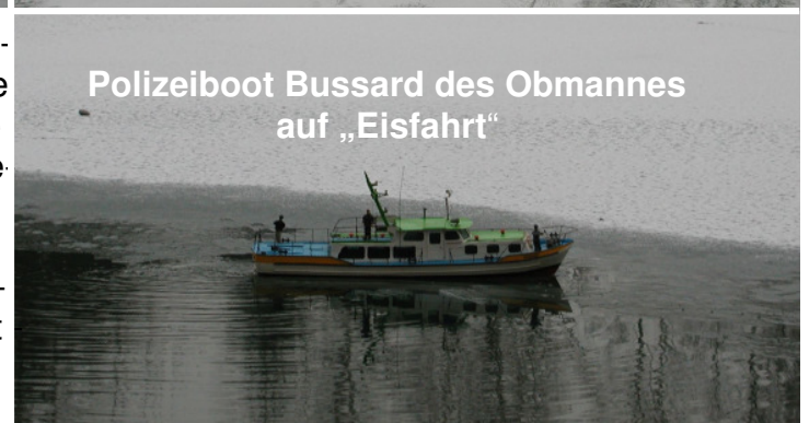
Polizeiboot Bussard des Obmannes auf „Eisfahrt“

Der heurige Februar, hat uns mit richtig kalten Temperaturen gezeigt, dass sich der Winter noch lange nicht geschlagen gibt. Er lässt uns Hobbykapitäne wohl noch länger auf die erste Ausfahrt am Clubgewässer warten. Die Wenigsten nennen ja einen kräftigen Eisbrecher ihr Eigen! Es gibt aber auch Ausnahmen, die warm eingepackt, trotzdem mit ihrem Modell eine Ausfahrt wagen. Doch aufgepasst mit dem „Eisbrechen“! Eine Bergung vom Eis bei 1 Grad Wassertemperatur ist nicht so angenehm!