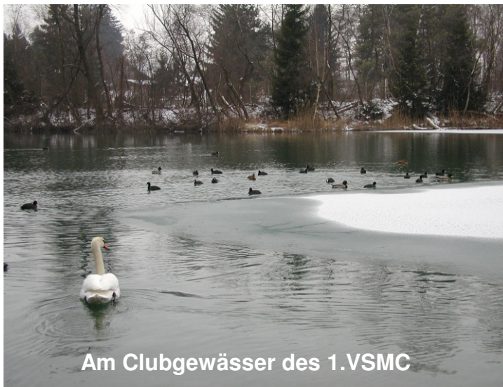
Am Clubgewässer des 1.VSMC

In den alemannischen Modellwerften herrscht zurzeit sicher Hochbetrieb! Heißt es doch, die Schiffmodelle für den Saisonstart zu überholen, die Akkus auf Ausfälle hin zu kontrollieren oder gar einen Neubau fertig zu stellen. Nicht anders auch beim Obmann, der sein altes Model, die Argo für die nächsten Einsätze weiter ausbaut hat, was aber fast nicht mehr möglich erscheint!