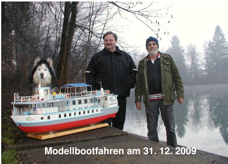
Modellbootfahren am 31. 12. 2009

Da solche Schiffsmodellfahrten mitten im Winter wohl eher die Ausnahme darstellen werden, starten unsere Mitgliedsvereine ihr „Anfahren“ verständlicherweise unter angenehmeren Bedingungen, also frühestens im April.