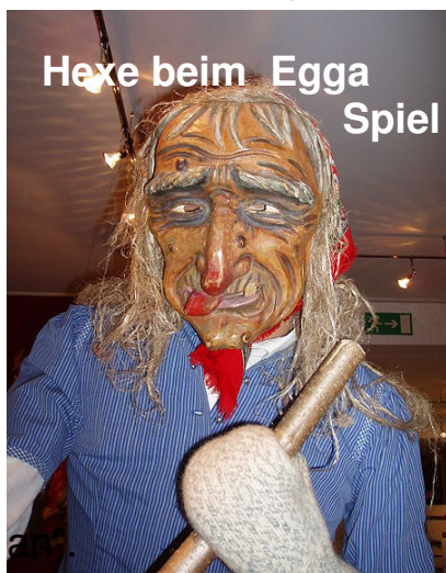
Hexe beim Egga Spiel

Zusätzlich zu den Funken wird in manchen Regionen, wie zum Beispiel in Bernau im Südschwarzwald, das Scheibenschlagen praktiziert, bei dem brennende Holzscheiben in die Luft geschleudert werden. Dieser Brauch dürfte eventuell noch älteren Ursprungs sein, denn aus dem lateinischen Brandbericht des Benediktinerklosters Lorsch geht hervor, dass eine brennende Holzscheibe, die Burschen am Abend des 21. März 1090 geworfen hatten, den Brand des Klosters verursacht haben.