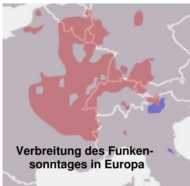
Verbreitung des Funken-sonntages in Europa

Bis zum Abend des Faschingdienstag wird also mit Umzügen, Bällen und Tanzveranstaltungen kräftig gefeiert, bis die Musik kurz vor Mitternacht die „letzten Drei“ aufspielt. Die eigentliche Fasnacht endet abrupt am Aschermittwoch um 00 Uhr.