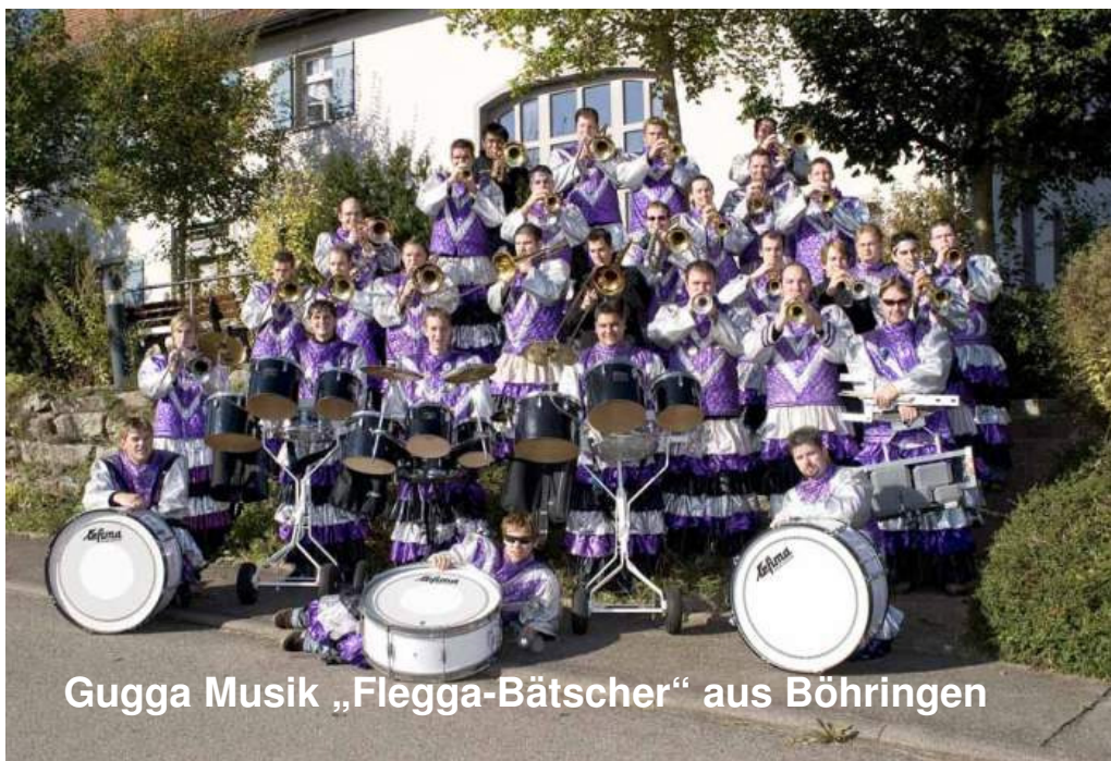
Gugga Musik „Flegga-Bätscher“ aus Böhringen

Bis zum 2. Februar, die Christbäume werden schon lange vorher wieder „abgeräumt“, bleiben in vielen Stuben die Weihnachtskrippen stehen. Der Bau von Weihnachtskrippen erlebte in den letzten Jahren wieder eine sensationelle Renaissance. In fast allen Gemeinden sind Krippenbauvereine entstanden, die sich ganzjährig unter der fachkundigen Leitung von Krippenbaumeistern (Auch das gibt es!) dem Bau von regelrechten Kunstwerken widmen und im Advent in Ausstellungen präsentiert werden.