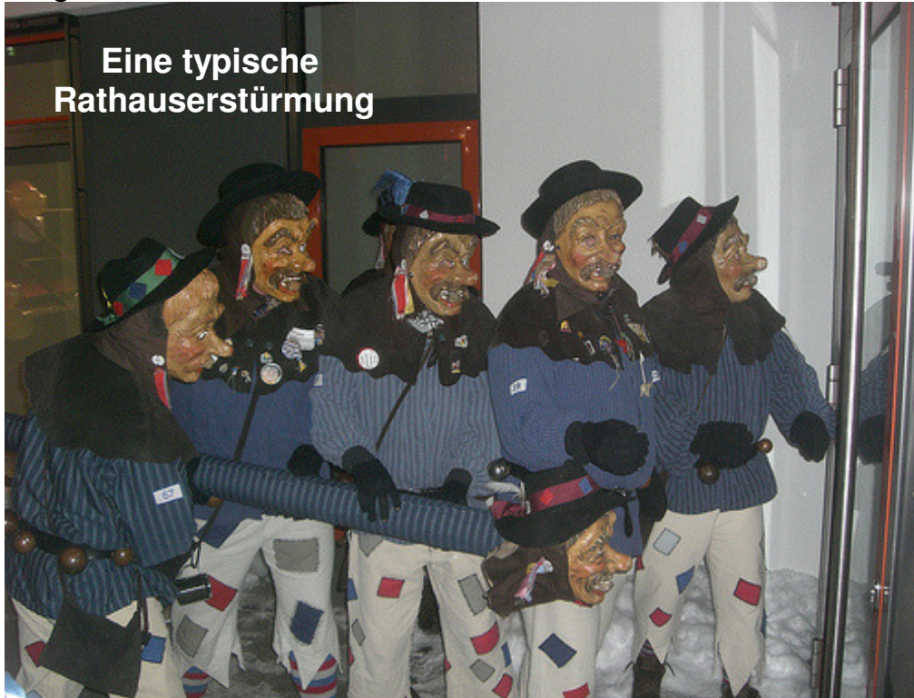
Eine typische Rathaussturmung

Mit der Woche vor dem Faschingssonntag steuert die Fasnat ihrem Höhepunkt zu. Den Anfang macht der sogenannte „ Gumpige “ oder „ Schmotzige “ Donnerstag. Im hohen und ausgehenden Mittelalter bis in die Neuzeit war dieser Donnerstag die letzte Möglichkeit, vor der österlichen Fastenzeit Fleisch zu essen. Der Ursprung des